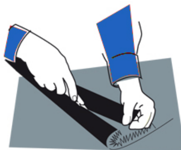
Corte del Rollo

Coja un rollo del césped y déle la vuelta, de forma que la parte inferior del rollo quede boca arriba. Corte con el cutter, ayudándose de la regla, la base negra de todo el rollo a unos dos milímetros de la fila de la costura del cosido de las fibras sintéticas más cercana a donde desee hacer el corte. Tome su tiempo y corte cuidadosamente el rollo.